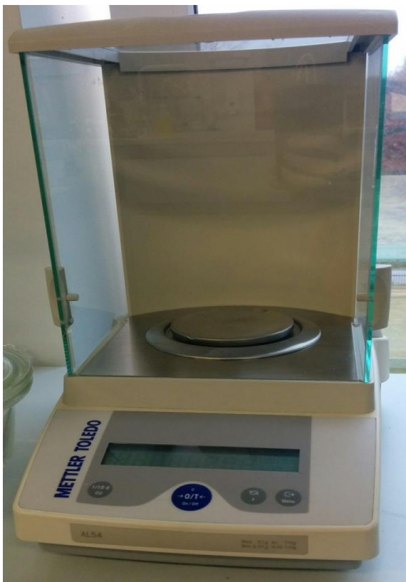
Joonis 2. Analüütiline kaal.

Illustreerivat materjali (joonis, tabel, tsitaat vm) ei esitata ilma vahepealse tekstita järjest.